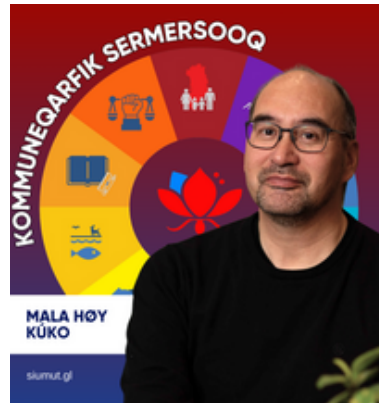
Mala Høy Kúko